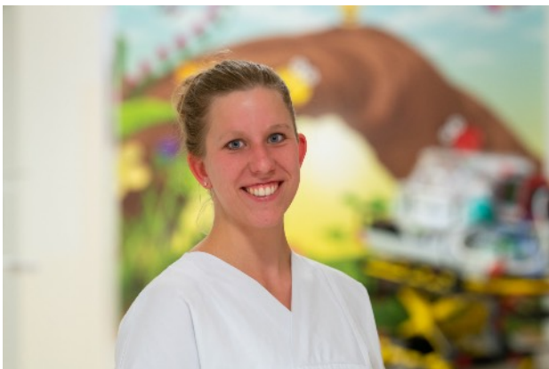
Portrait Arbeit für das AMEOS Klinikum