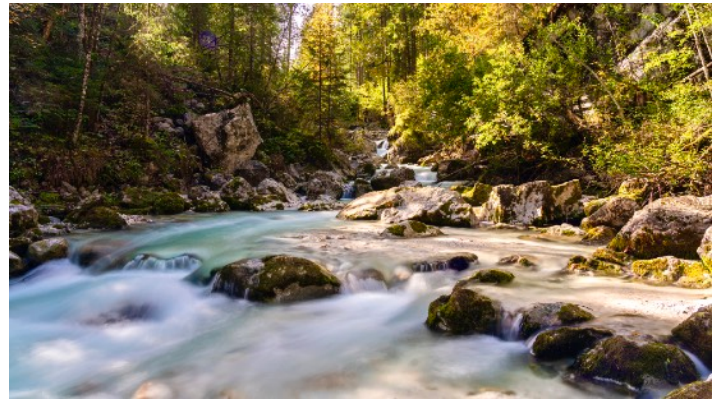
Landschaft im Zauberwald Berchtesgaden