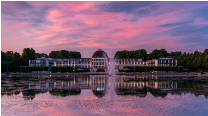
Das Dorint Parkhotel in Bremen

Meine Bilder wurden schon in Zeitungen, Medien, Kalendern und Prospekten veröffentlicht so wie als Großleinwände für Konferenzräume gedruckt.